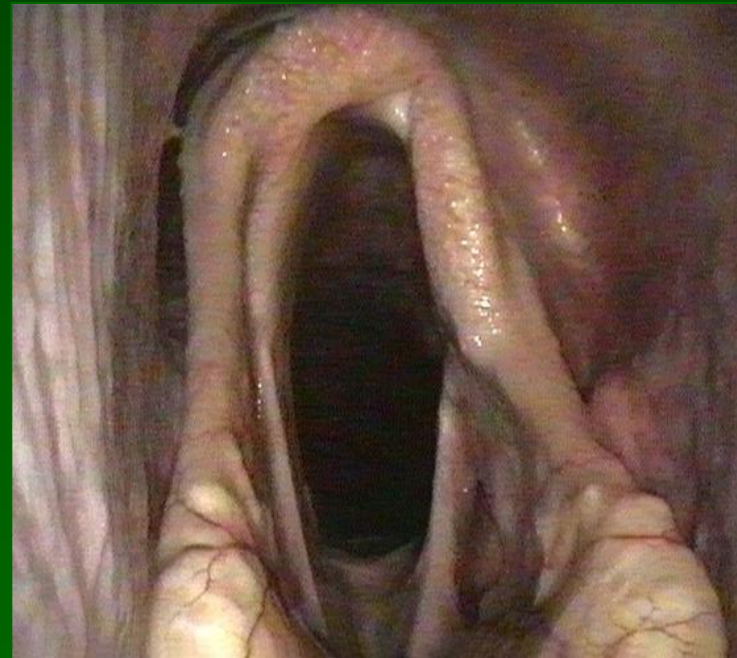
Cv emiplegia laringea sx