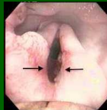
Cn Eversione sacculi laringei