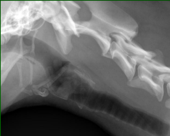
Cn Laringe normale