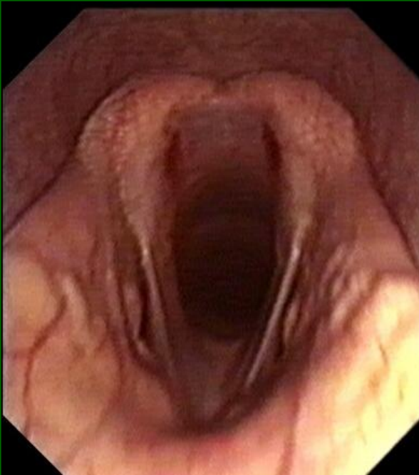
Cv laringe normale