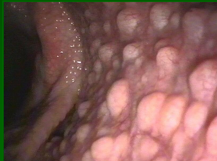
Cv faringite follicolare